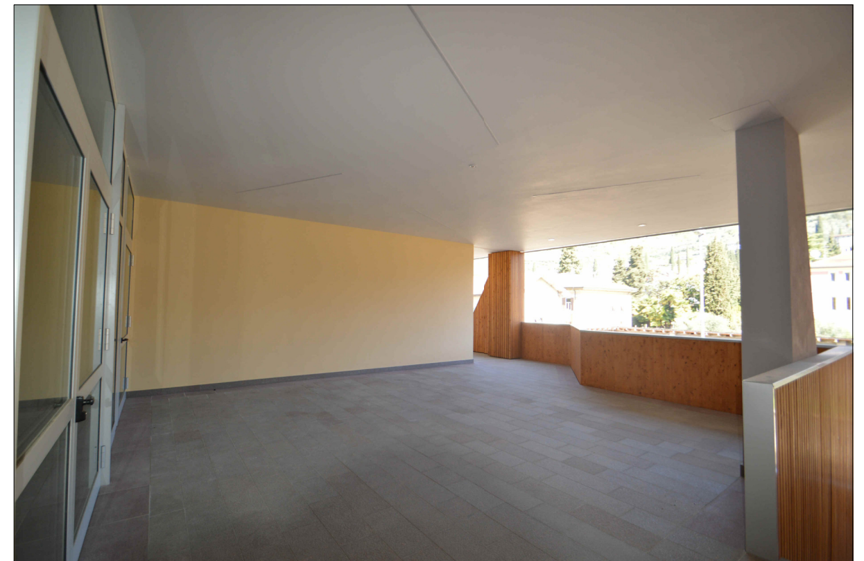
FOTO DELLA PARETE A DISPOSIZIONE DELL'OPERA D'ARTE